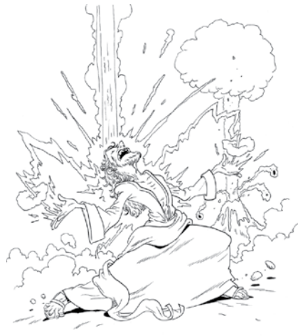
Illumination de Saint Paul par un peintre baroque.