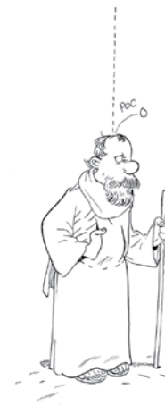
Illumination de Saint Paul par un peintre protestant.