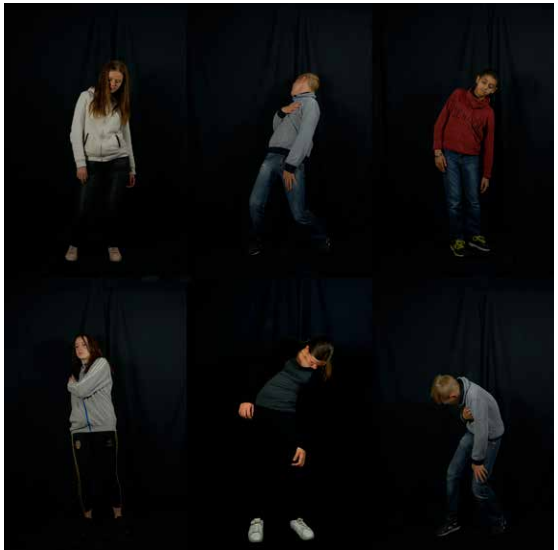
De gauche à droite, de haut en bas : École Turgot, Lille / École Léon Blum, Lomme / Collège Jean Zay, Lomme / École Jean Minet, Lomme / École Jean Minet, Lomme / École Léon Blum, Lomme / École Léon Blum, Lomme / École Lakanal, Lille